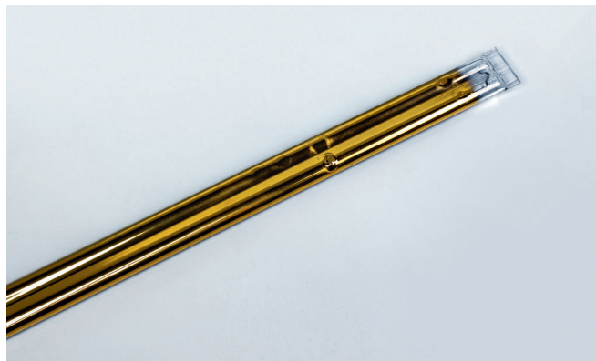
Nowy promiennik podczerwieni IR Professional firmy HEIDELBERG.

Jeśli masz jakiegokolwiek pytania, skontaktuj się z przedstawicielem działu serwisu.