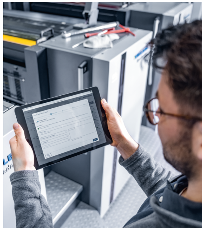
Regelmäßige Wartung durch unsere Serviceexperten sichert die Höchstleistung Ihrer Maschine.

Die Ergebnisse der Maschinenwartung werden in einem umfassenden Bericht dargestellt. Dieser bewertet den Gesamtzustand Ihrer Druckmaschine und den Zustand der einzelnen Komponenten. Er erläutert auch einen gegebenenfalls festgestellten Verschleiß. Folgemaßnahmen können effektiv geplant werden.