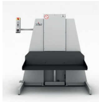
Beim Beladen sorgen Stapellifte für mehr Ergonomie.

Der POLAR Schnellschneider bietet bereits in der Grundausstattung umfangreiche Ausstattungsmerkmale, welche die Produktion deutlich steigern können. Auch der Erwerb eines kompletten Cutting System 200 inklusive Schnellschneider berechtigt zur Teilnahme an unserer Aktion „Solo to Systems“ mit Gratis-Lift und Sonderpreis!