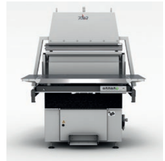
Rüttelautomat RA zur lagenweisen Vorbereitung von Schneidgut.