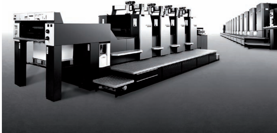
Heidelberg Praha otevřel nové oddělení specializované na obchod s použitými stroji.

Akce byla zaměřena především na možnosti zpracování obalů, návštěvníci se mohli seznámit s možnostmi využití výkonných