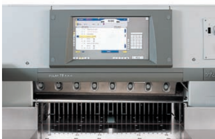
Tiskárna Finidr si pořídila již druhou šičku tavnou nití od Heidelbergu.

Nejednalo se ale o jedinou instalaci v roce 2011. Dále totiž do tiskárny Finidr putoval kombinovaný skládací stroj Stahlfolder KH 78/4-KL v konfiguraci se 4 kapsami a křížovým lomem.