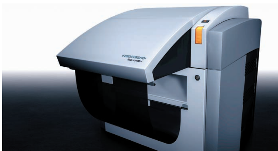
Termální CtP Suprasetter bylo v roce 2011 zdaleka nejprodávanějším CtP v České republice!

Dle oficiálního výzkumu trhu (zpracovala firma Grafie CZ) je v současnosti Suprasetter zdaleka nejprodávanějším CtP zařízením v České republice! V roce 2011 společnost Heidelberg nainstalovala hned 10 nových CtP zařízení, což z ní tvoří jednoznačného lídra na tuzemském trhu. Deset nainstalovaných CtP zařízení před-